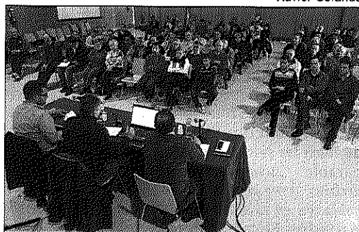
El Ayuntamiento ofreció la posibilidad de firmar instancias en contra del ARE.

una presentación que se proyectó en una pantalla. De nuevo se recordó que el ARE implicaría un crecimiento de golpe en la zona de más de 600 viviendas, la mitad de las cuales serían de promoción pública. El gobierno de La Roca se muestra contrario al proyecto de la Generalitat porque la edificabilidad no es similar a la que ha tenido el barrio históricamente y porque implicaría doblar la po-