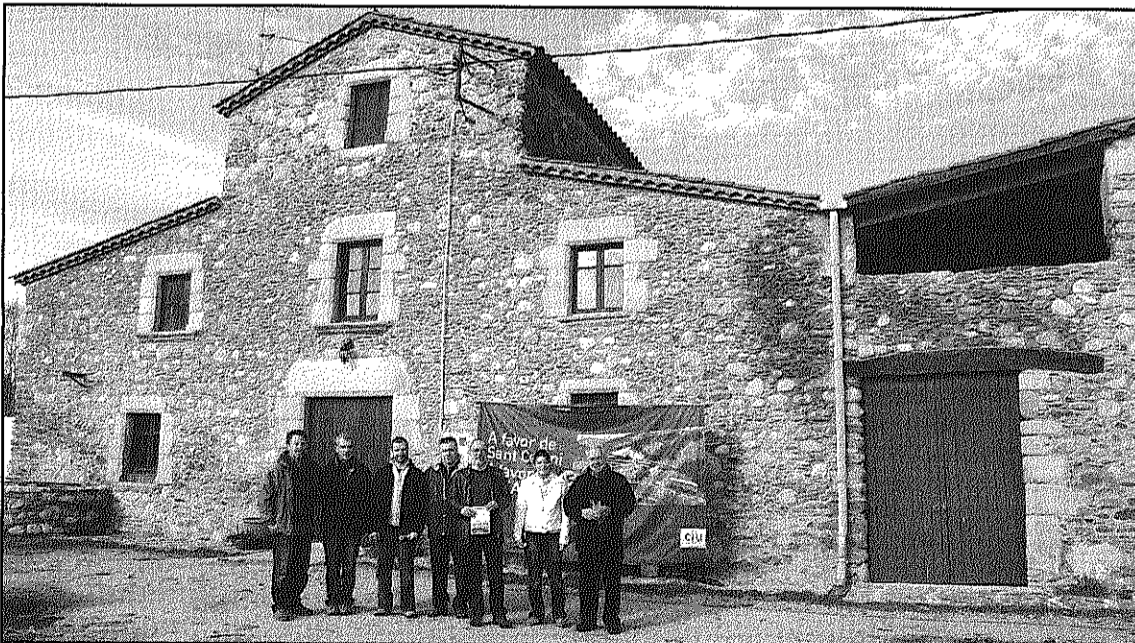
Representants de CiU davant de la masia de Can Riera de l'Aigua abans de la passejada