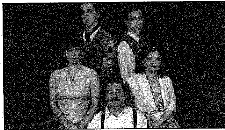
Els actors presenten l'obra 'Nunca estuvis tan adorable'