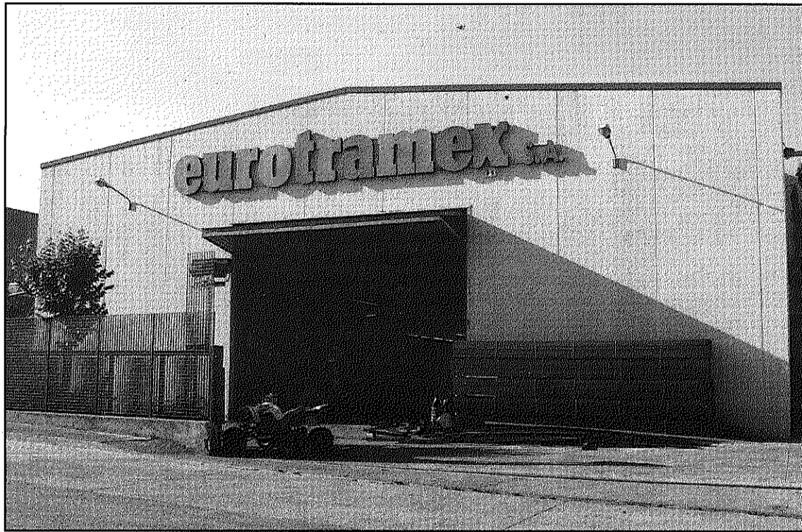
El lladres van accedir a fins a tres naus pel mètode del butró

Aquest són alguns dels casos que han transcendit en els darrers dies malgrat n'hi ha d'altres que, o bé perquè no es fan públics o bé per garantir el procés d'investigació de cara a resoldre'ls, no surten a la llum. La situació, però, es va analitzar en la darrera Junta de Seguretat Local de Sant Celoni de fa uns dies. Aquest és el màxim òrgan en aquesta matèria al municipi i hi són presents l'administració i representants dels cossos i forces que en tenen competència.