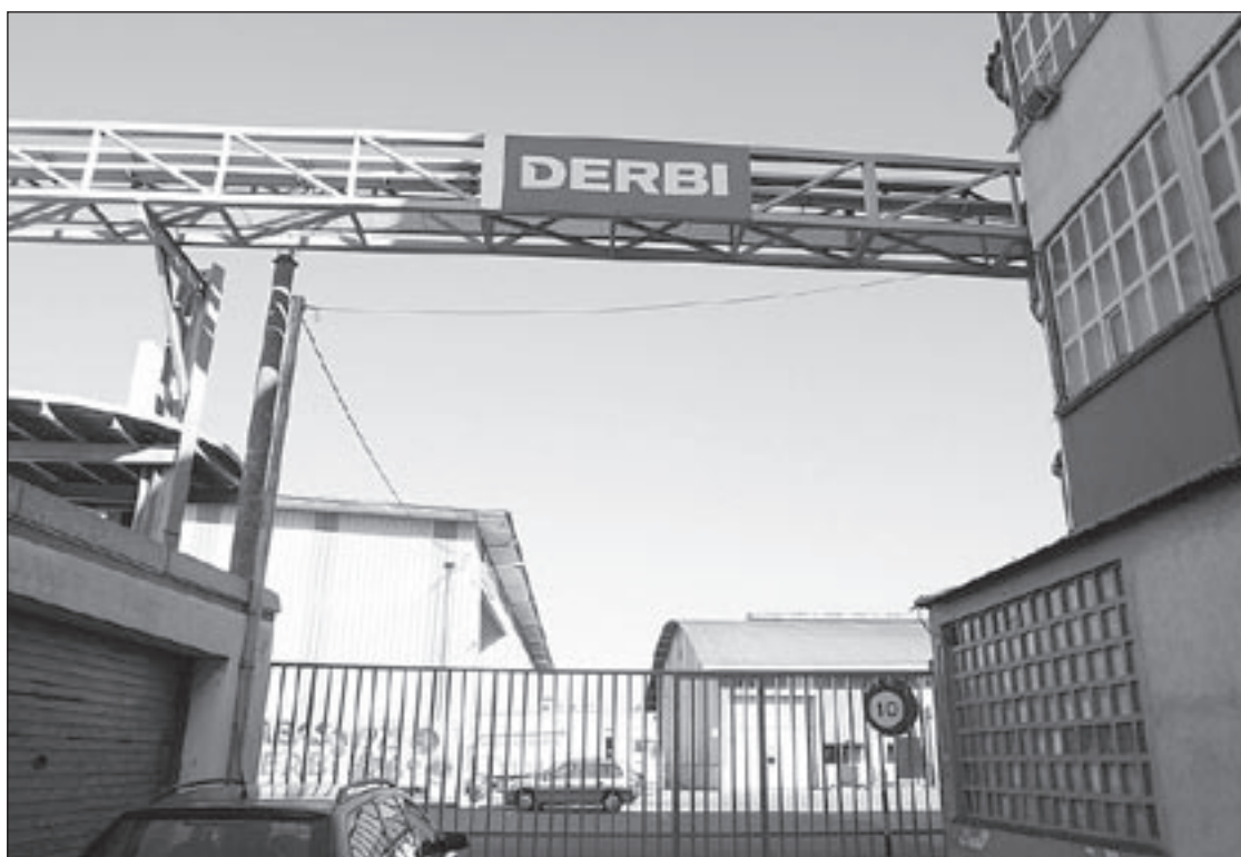
Derbi ha aconseguit un increment notable de venda de motos en el primer trimestre de l'any

El grup Cepex, integrat en el conglomerat d'empreses de Fluidra, ha potenciat la condició de líder europeu del mercat de reg. Els responsables de Fluidra destacaven aquest lideratge durant la junta d'accionistes que va tenir lloc divendres. Cepex ha aconseguit consolidar la posició amb les compres d'Irrigarone i Master Riego.