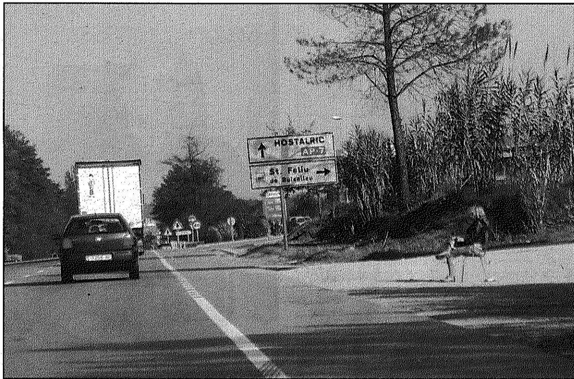
L'operació va permetre la detenció de 13 persones per proxenetisme i explotació sexual (L'ADBM)

Concretament, els detinguts formaven part d'una xarxa organitzada amb proxenetes estructurats en un sistema cooperatiu. Operaven amb l'ajut d'una àmplia infraestructura dissenyada pel transport, la distribució en diversos punts i el control de les dones subjugades per cadascun dels seus