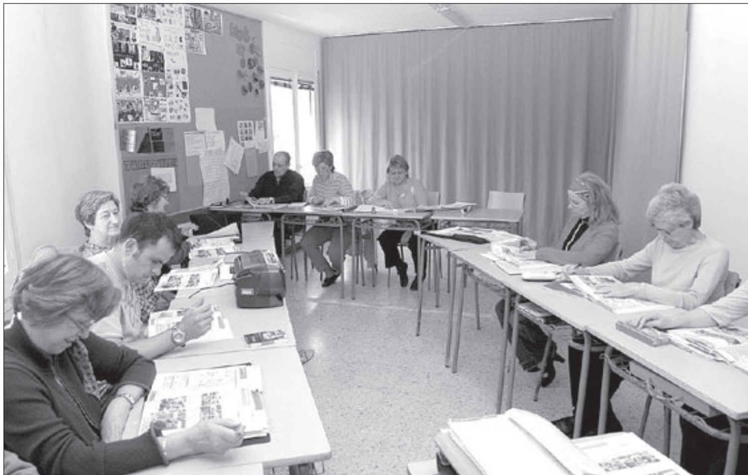
Una de les classes de l'escola d'adults de Sant Celoni, aquesta setmana