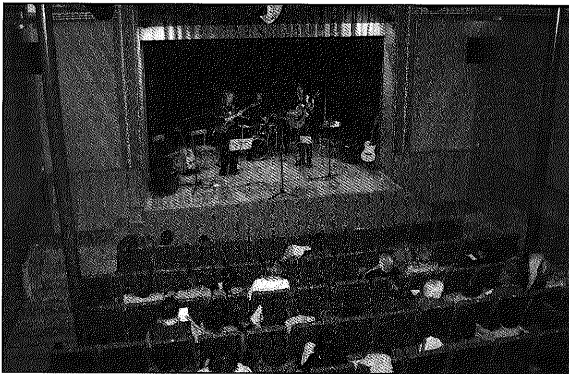
El Cicle de Concerts d'Arbúcies està obtenint un notable èxit de públic (AdBM)

El quartet de corda interpretarà una selecció de música de cambra