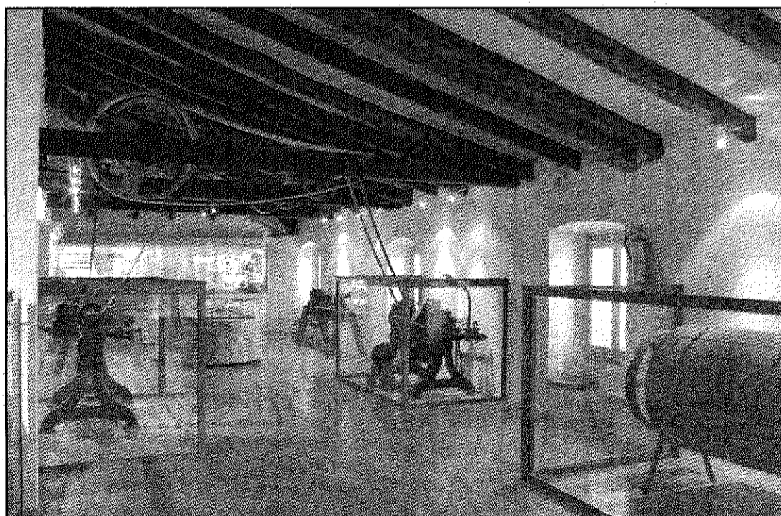
Una de les sales del Museu Etnològic del Montseny "La Gabella" d'Arbúcies

Així, la setmana passada "La Gabella" commemorava que el 24 de maig de 1909 es va crear el primer Parc Natural europeu, a Suècia. Des de 1999, que se celebra aquesta diada, que serveix per sensibilitzar a la societat i donar a conèixer el valor dels espais naturals protegits. En aquesta ocasió, la jornada porta per lema "Natura sense fronteres", i s'organitza conjuntament a 38 països de tot Europa integrats dins l'organització Europarc. Aquesta agrupa les