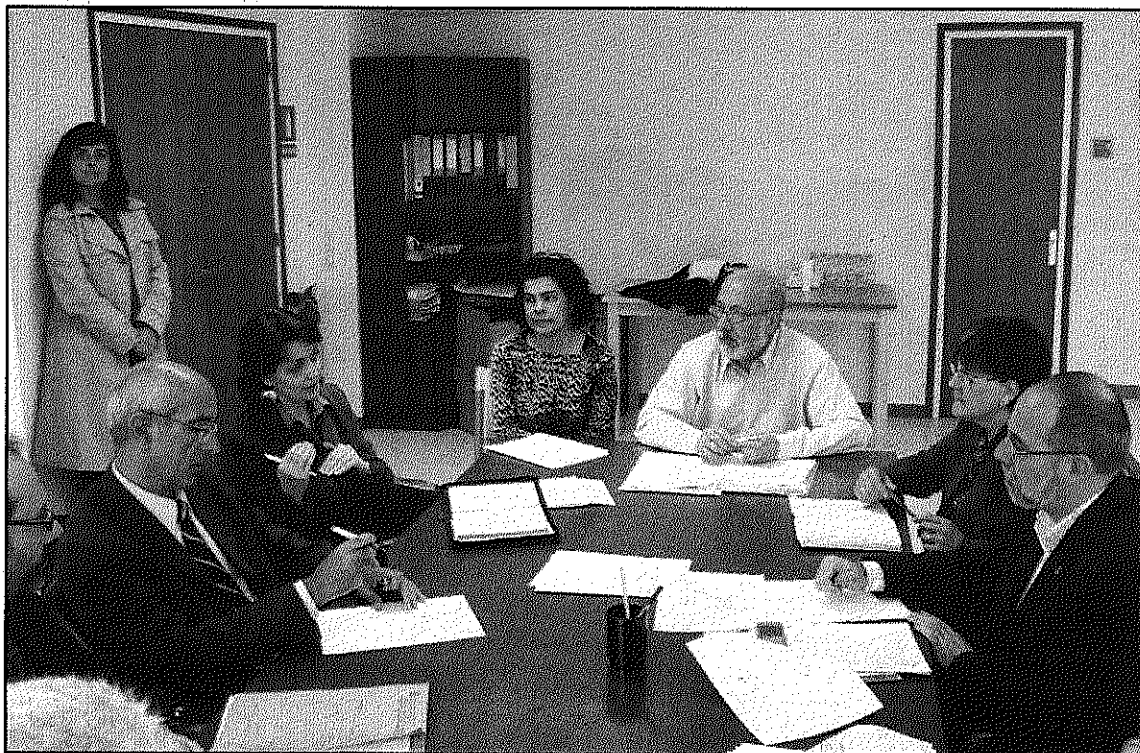
Una imatge de la primera reunió mantinguda a Gualba amb el Director de Protecció Civil

Des de Gualba també es vol conèixer el contingut de l'expedient, ja que el Consistori ha decidit emprendre accions legals contra l'empresa si es confirma que es va produir alguna negligència per part de Carbueros Metálicos, tal i com va assegurar fa uns dies el conseller d'Interior, Joan Saura.