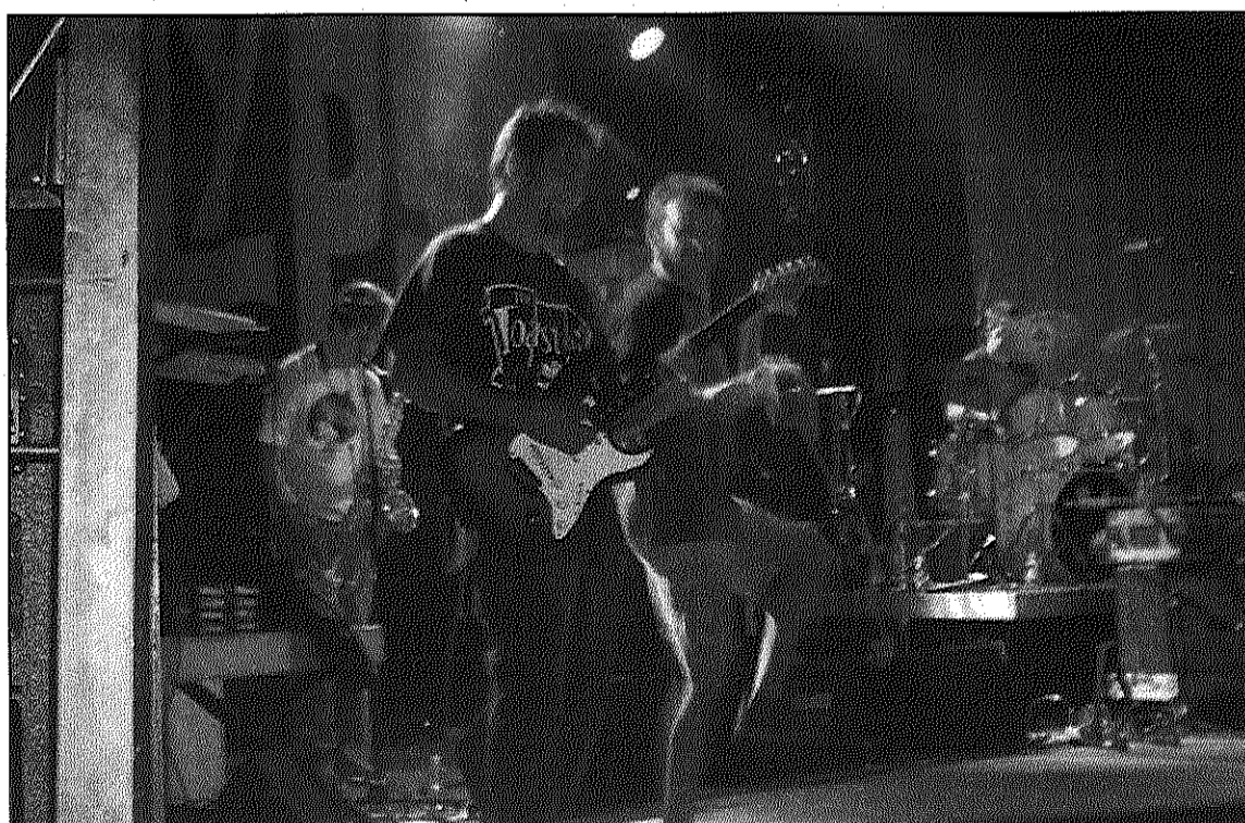
Dr. Calypso serà un dels grups destacats del FesTour que arribarà a Sant Celoni (AdBM)

La resta de parades del FesTOUR seran a Deltebre (31 de maig), Artesa de Segre (11 d'octubre) i un municipi de les comarques gironines, encara per determinar. I és que aquest festival, que l'any passat va moure més de 17.000 persones, ha crescut enguany fins a organitzar un concert en una població de cada demarcació catalana; Sant Celoni és, doncs, l'escollida a les comarques barcelonines. Els grups Obrint Pas o Sotazero són