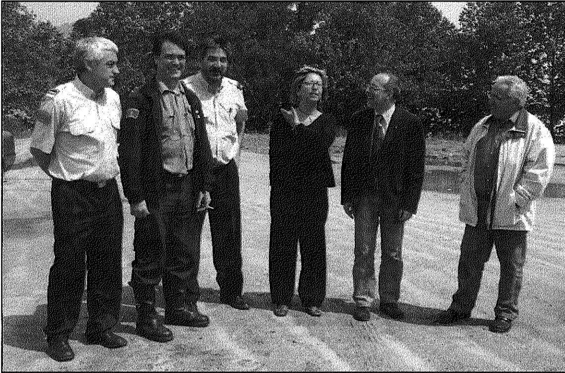
Una imatge de la visita que es va fer dilluns als terrenys del futur nou Parc de Bombers