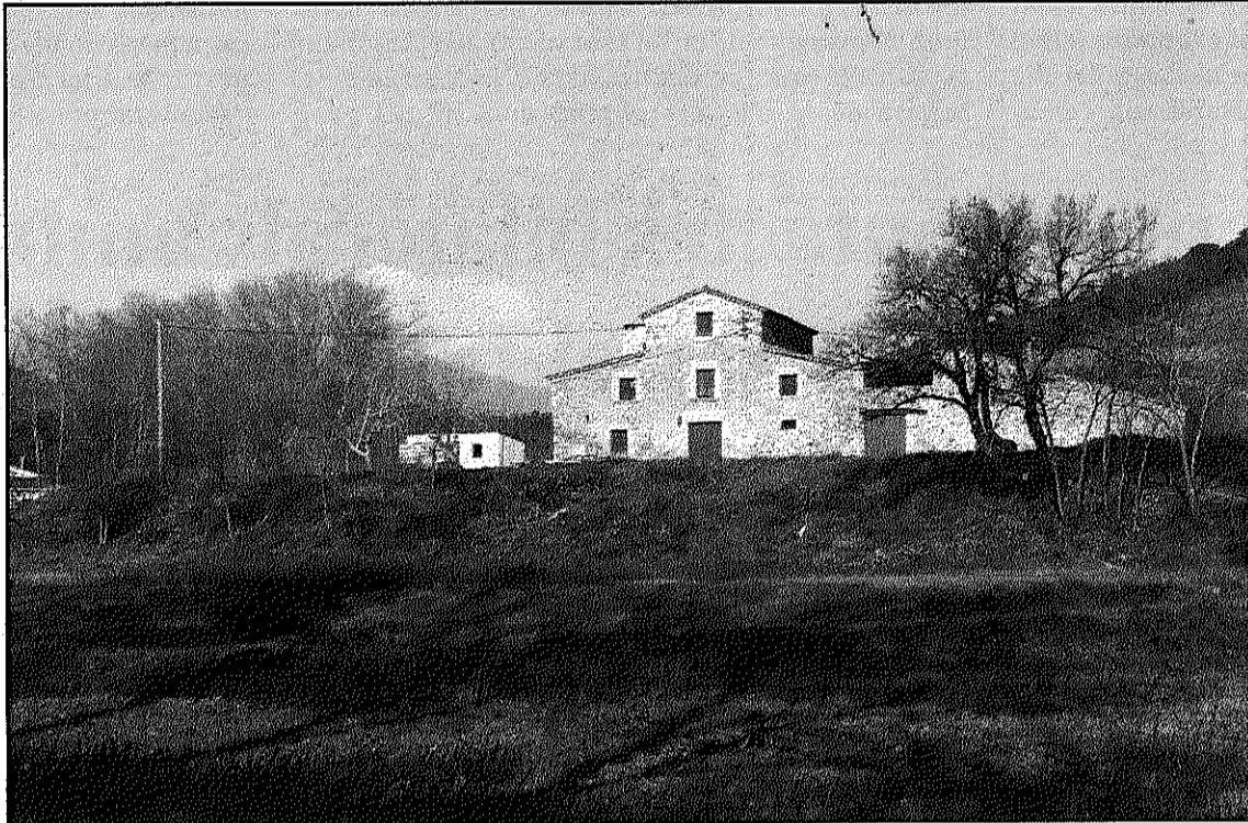
El document posa de relleu la fragilitat de l'entorn de Can Riera de l'Aigua (L'AdBM)

El document, encarregat a l'empresa Minuàrtia, desgrana elements que podrien dificultar el desenvolupament de l'ARE, com la presència de la masia de Can Riera com a edifici protegit. Per contra, reconeix que l'abandonament de zones de conreu a la zona i els moviments de terres practicats per a les obres del TAV fan que la part central afectada per l'ARE tingui un valor estètic molt baix, en contraposició a la zona dels Maribaus o la pròpia riera del Pertegàs. Pel que fa a la inundabilitat dels terrenys, l'informe assenyala que, tot i que el municipi en general presenta un nivell de risc molt alt, el fet de no disposar de limitació hidràulica de les zones inundables, tot i que es pot establir que un 31 per cent de l'àrea, uns 78.900 metres quadrats, es podrien considerar zones inundables.