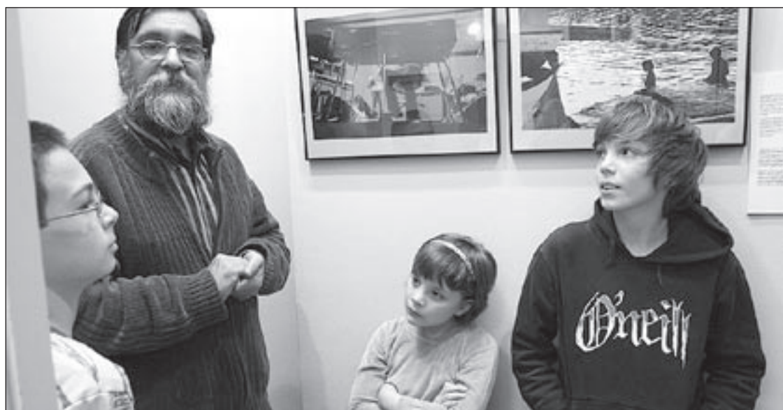
L'exposició es va inaugurar dijous al vespre a l'Aliança Francesa