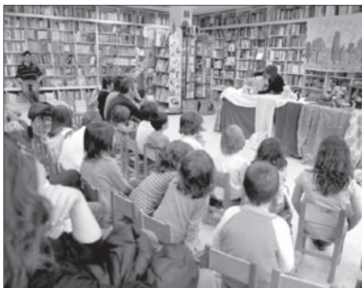
Contes, poesia i música van servir per celebrar els 25 anys d'Els Quatre Gats

És el tercer acte del desè aniversari. Els anteriors van ser una bufada d'espelmes per Carnestoltes i la trobada d'escoltes catalans durant el primer cap de setmana de març. El mes que ve es pintarà un mural a una paret del local de l'entitat, a l'escorxador, on s'intentarà resumir aquesta dècada. El cau té ara una vuitantena de nens i joves, dels 5 als 18 anys.