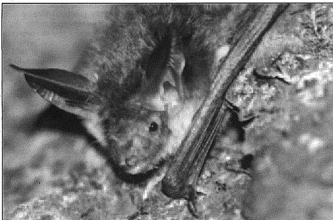
Una imatge del ratpenat capturat al Montseny

La captura fa arribar fins a 21 les espècies de ratpenats presents al Montseny i suposarà una empenta de cara a l'intent de constatar la cria d'aquesta espècie a Catalunya, fins ara no observada. L'animal, un mascle, va ser capturat en el marc de les estades de recerca del Puig, organitzades cada any pel Parc Natural del Montseny i que, en aquest cas, duia a terme el biòleg del Museu de Ciències Naturals de Granollers Carles Flaquer.