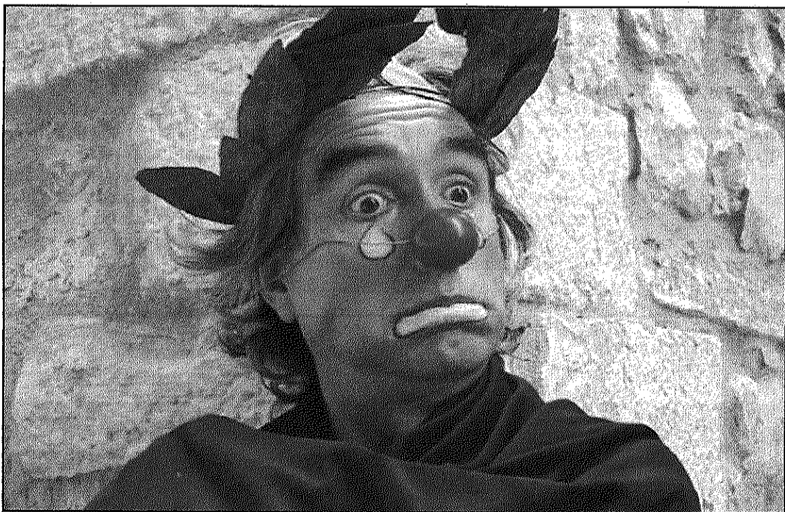
Claret Clown, en la imatge promocional del seu espectacle "Sóc un pallaso" (A4BM)

El clown de Sant Esteve presenta el seu espectacle 'Sóc un Pallaso'