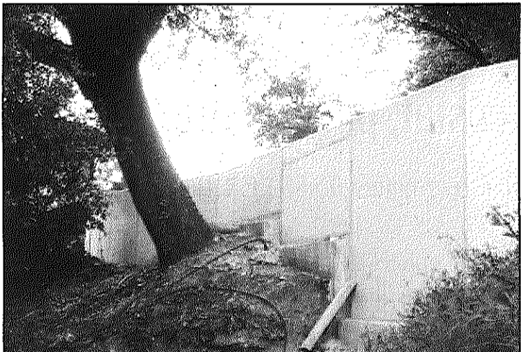
Un dels murs de les obres del camí de circumval·lació