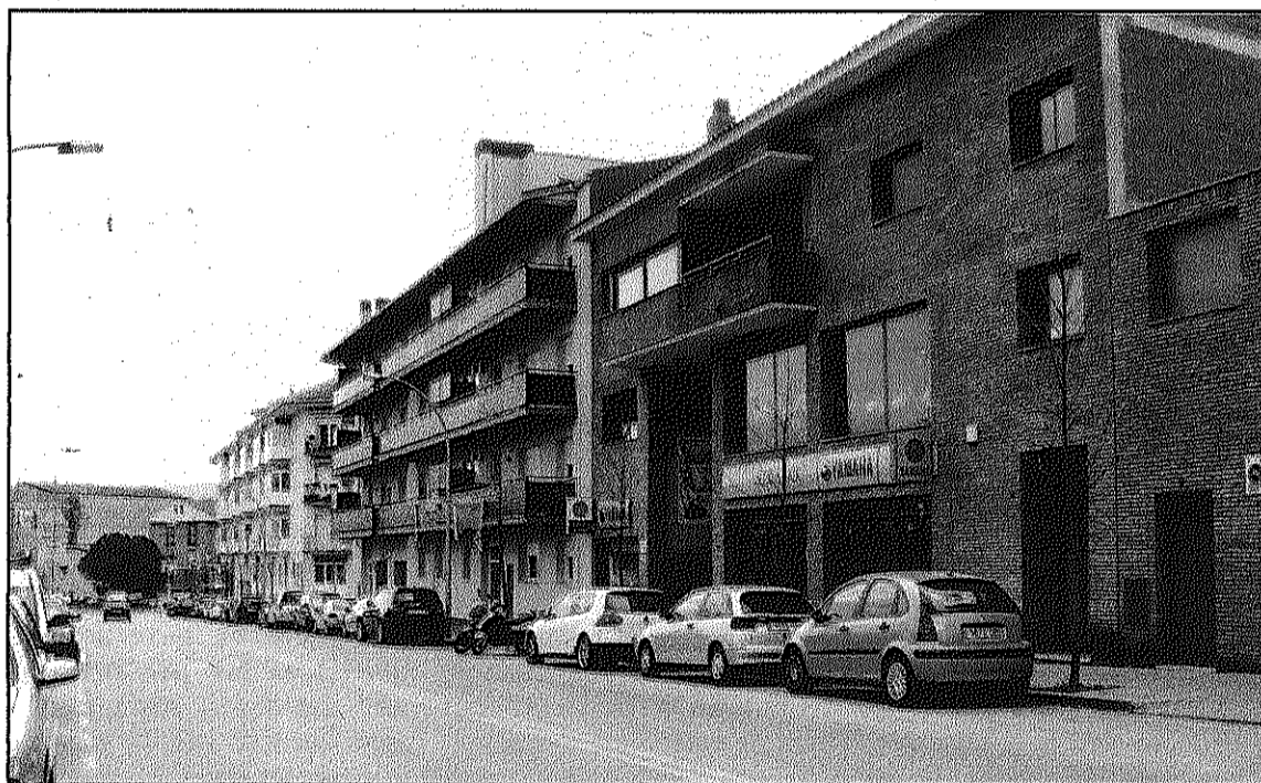
El carrer Esteve Cardelús, en l'àmbit de la nova associació (L'AdBM)

El compost es pot utilitzar per a l'agricultura i d'aquesta manera s'estalvien recursos i es redueixen els fertilitzants químics que poden ser una font de contaminació d'aqüífers i altres ecosistemes.