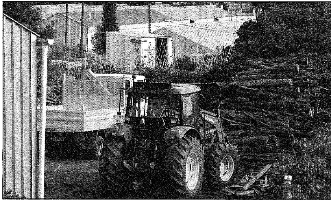
Una imatge de la planta de compostatge de residus verds de Cabrils (L'AdBM)

Segons Deulofeu, per a Sant Celoni "serà interessant disposar d'un recurs com aquest a prop" de cara a l'e-