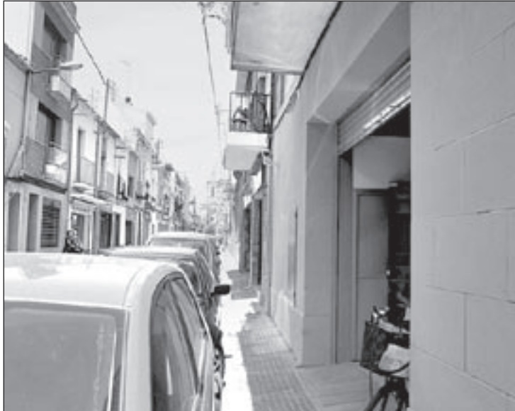
Les noves instal·lacions per l'entrada del carrer Ricomà

Les noves dependències tenen uns 800 metres quadrats dues sales d'espera amb una capacitat per a 400 persones. Això ha de permetre eliminar les cues de gent al carrer que hi havia a Isabel de Villena per les