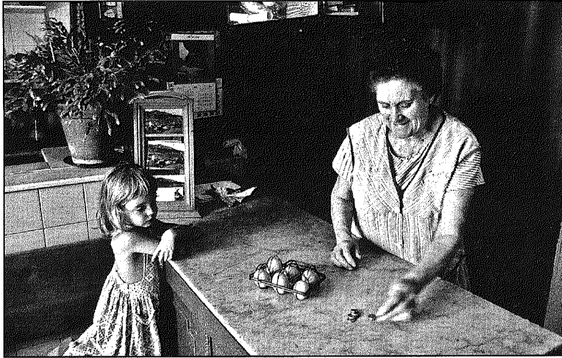
Una de les imatges que formen part de l'exposició sobre Joanet, a Arbúcies (MARTÍN GALLEGO)

Amb totes aquestes imatges, Gallego ha volgut transmetre la calma i el ritme pausat que es respira en l'espai natural privilegiat que ocupa aquesta població. Segons el mateix fotògraf, es tracta de "l'encant de la senzillesa", i pretén ser una crònica social i visual d'un espai de temps concret a Joanet, destacant els racons petits, els detalls que normalment passen desapercebuts i, sobretot, l'entorn natural que ocupa aquest escenari. Com afirma l'autor, "la fotografia és l'art de mirar, i