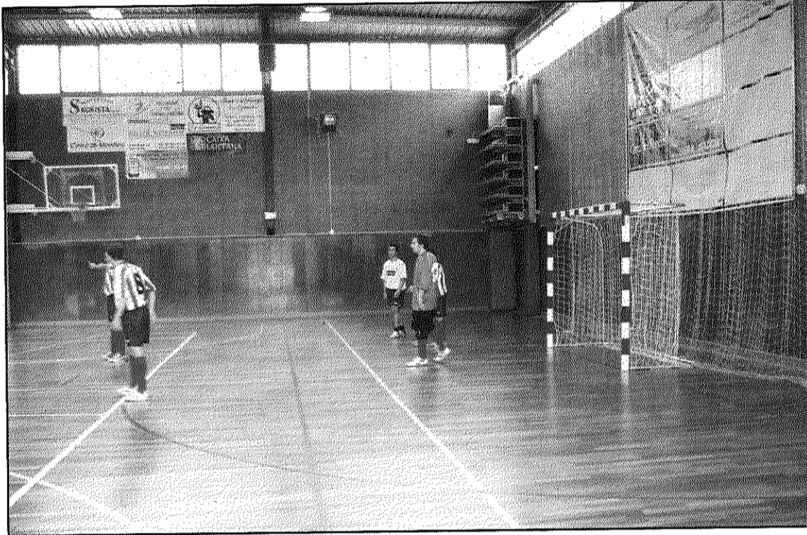
El FS Sant Celoni és a un pas d'aconseguir una posició per optar a l'ascens (L'AdBM)

Pel que fa a Preferent, el CFS Vilamajor va perdre 3-6 davant el CE Barceloneta i estorna a complicar la situació de l'equip de Sant Antoni a la part baixa de la taula. A manca de tres jornades en el seu grup, necessita aconseguir un bon resultat aquest cap de setmana a la pista del FS Polinyà