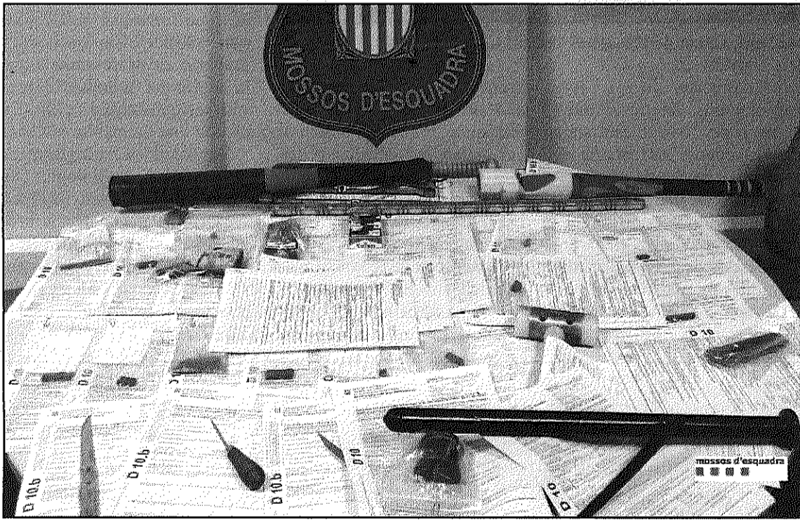
Una imatge del material intervingut durant el dispositiu policial de dissabte

REDACCIÓ. Sant Celoni Un dispositiu dels Mossos d'Esquadra de Sant Celoni a l'entorn de la discoteca Pont Aeri la nit de dissabte a diumenge va saldar-se amb més de 60 denúncies i una detenció. En concret, es van produir 20 denúncies per consum de begudes alcohòliques, 30 per tinença i/o consum de substàncies estupefaents, 2 per tinença d'armes prohibides, 7