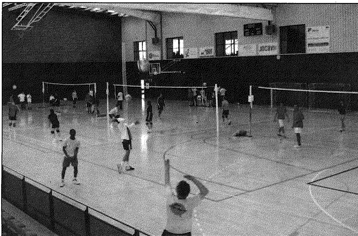
Una imatge del Torneig de voleibol celebrat diumenge a Can Pons