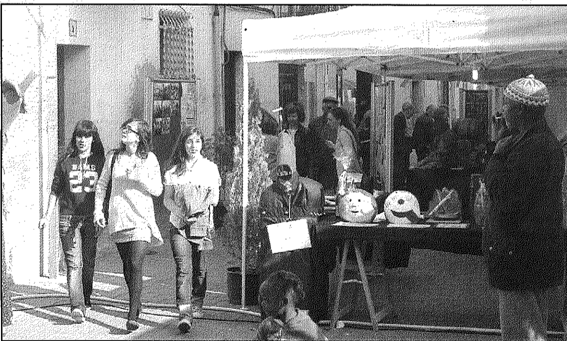
La setmana cultural de Sant Antoni comença aquest dissabte amb diverses activitats (AdBM)

Les parades de llibres i roses, així com el mercat del llibre usat romandran oberts tot el dia de Sant Jordi a la plaça de la Vila. També relacionat amb la diada de Sant Jordi, aquest mateix dissabte es presenta el llibre "75 anys de futbol" a la població, organitzat pel club local a La Sala, i que ja es trobarà a la venda.