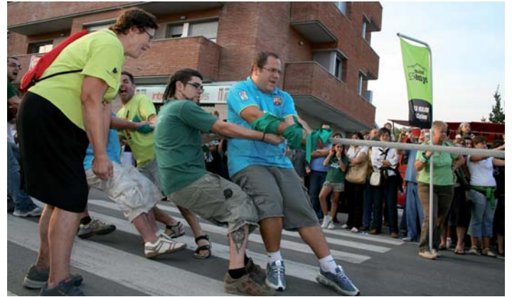
El carrer Esteve Cardelús ja va acollir l'estirada de corda 2007

SANT CELONI.- El procés participatiu endegat a finals de febrer per definir el model de festa major de Sant Celoni ja s'ha tancat, amb la presència de 40 persones representants de diferents entitats del municipi. D'aquesta manera es dona el tret de sortida a la preparació de la festa major d'enguany: s'ha decidit l'espai principal de la festa, les comissions de treball i un primer guió del programa.