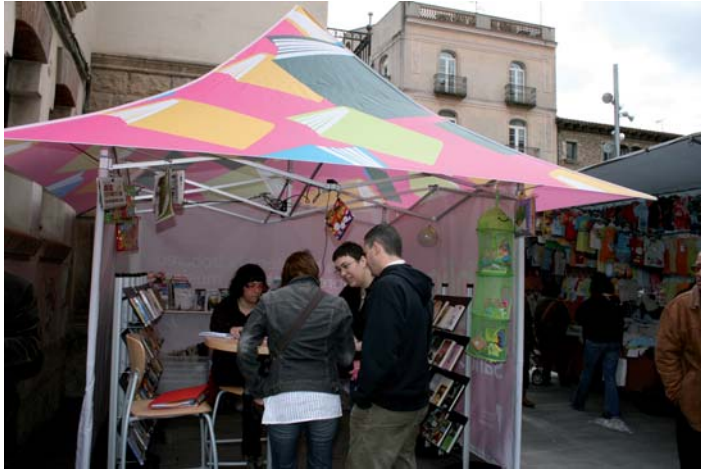
La carpa del Bibliomercat

SANT CELONI.- Aprofitant el mercat setmanal dels dimecres, s'ha posat en marxa el Bibliomercat, un nou servei que té l'objectiu de reforçar una de les línies estratègiques del servei de lectura pública per arribar a nous públics.