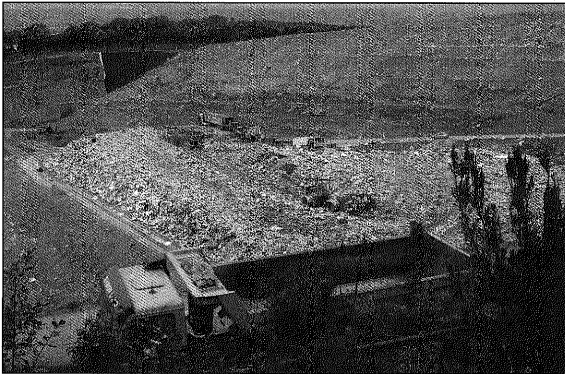
El Ple municipal haurà d'aprovar els termes de l'acord per al tancament de l'abocador (L'ADBM)

L'endemà de la celebració del Ple, el Conseller de Medi Ambient i Habitatge de la Generalitat, Francesc Baltasar, té previst desplaçar-se al municipi per rubricar l'acord entre ambdues administracions, refermant així el com-