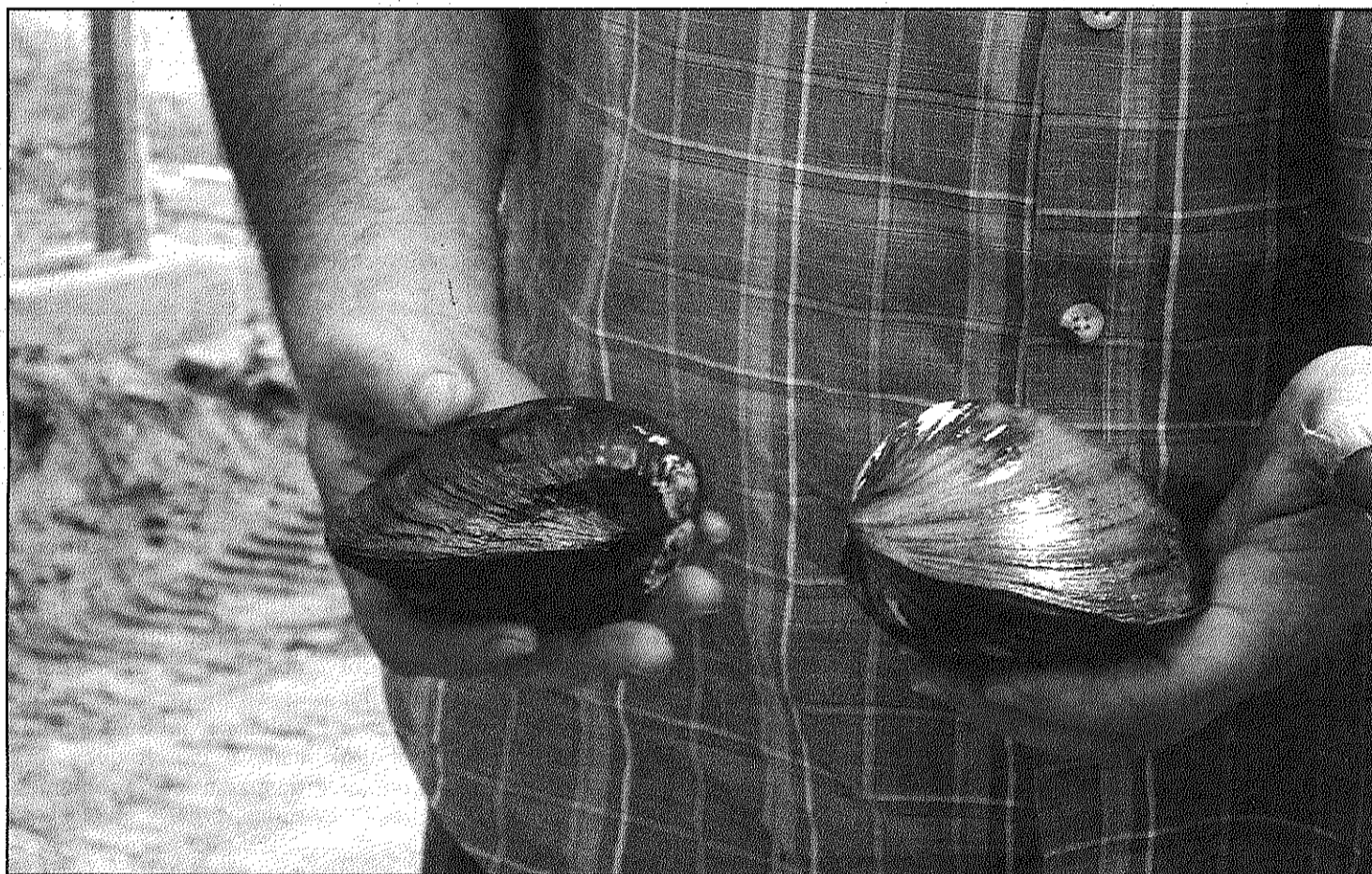
A la imatge, dos de la vintena d'exemplars vius que tenen entre 10 i 20 anys de vida i fan més de 20 centímetres (L'AdBM)

Troben netejant la bassa de la Farga d'Arbúcies una espècie pròpia de la Tordera que es creia extingida (Pàgina 14)