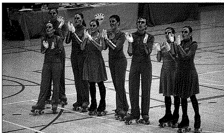
Las actuales campeonas del mundo de la modalidad continúan engrandando su palmarés.

El entrenador Jaume Pons , una vez más ha dado en el clavo