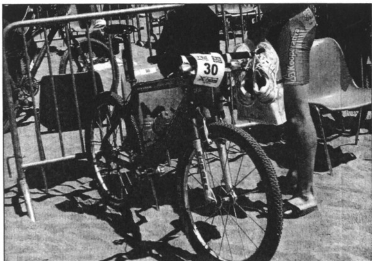
La prova combina el jòguing amb la bicicleta (L'ADBM)

Les sortides seran dissenyades i guiades per l'Escola de Natura amb l'objectiu de donar a conèixer el patrimoni natural. D'entre les 18 sortides que s'han programat a Llinars del Vallès, Sant Celoni, o Vallgorguina, a més de la de Sot de Bocs, hi ha "El Montnegre més feréstec: sots de can Presses", el dissabte 28 d'abril, i "Els banyants del Montseny en bicicleta", diumenge, 10 de juny. Les sortides, que són gratuïtes i obertes a tothom, tenen una durada de 2 a 4 hores i estan guiades per un expert coneixedor del territori que ajuda els participants a interpretar i comprendre els paisatges i a descobrir racons amagats del parc i els seus municipis. Per participar-hi tampoc és necessari fer una inscripció prèvia.