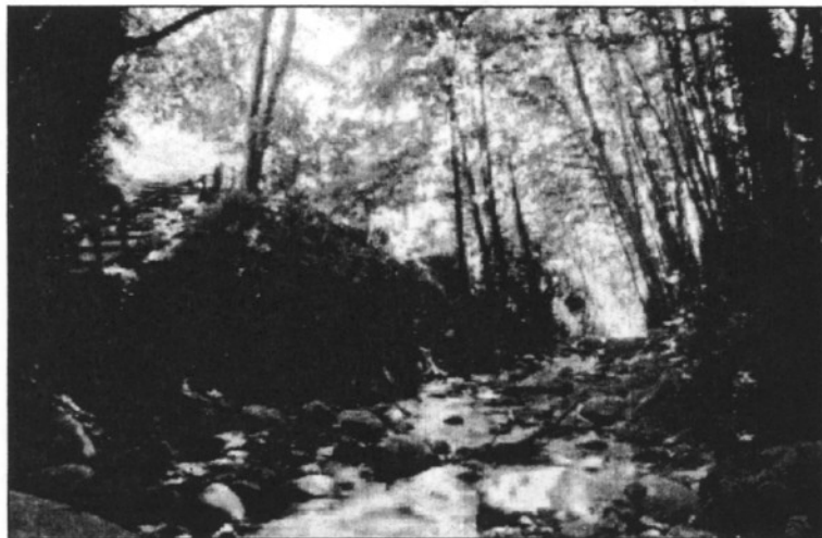
La riera d'Arbúcies serà un dels punts del recorregut programat per "El Camí" (L'AdBM)

Segons la proposta de l'associació, part del seu recorregut recorrerà pel Baix Montseny i, per aquest motiu, els ajuntaments de Sant Celoni, Santa Maria de Palautordera, Sant Esteve de Palautordera, Campins,