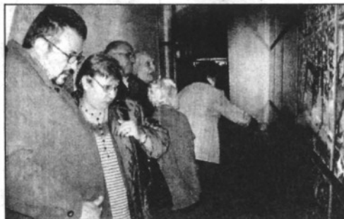
L'exposició es va presentar a Can Ramis al desembre

REDACCIÓ. Sant Celoni L'equip de govern de l'Ajuntament de Sant Celoni ha convocat per a dijous vinent el Ple extraordinari demanat per CiU on proposa la reprovació del tripartit municipal arran l'exposició i el catàleg 'Sant Celoni, tots sentits'. CiU acusa a PSC, ERC i ICV d'haver utilitzat aquesta exposició per fer electoralisme a les portes dels comicis del 27 de maig. El grup municipal de CiU també argumenta la seva petició en el fet que des del govern no s'ha donat resposta a les qüestions plantejades sobre la mostra que es va poder veure a Can Ramis i el catàleg distribuït posteriorment entre els veïns.