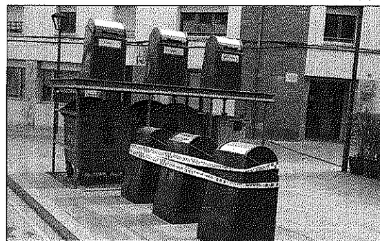
La dinámica intermunicipal se puede extender a la gestión de los residuos.