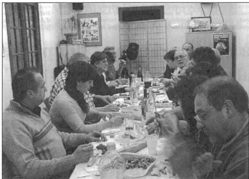
Una imatge del sipar celebrat el cap de setmana passat per l'entitat a la Batllòria