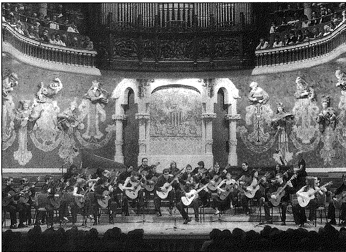
Una actuació de l'Orquestra de Guitarres de Barcelona al Palau de la Música (AdBM)

L'Orquestra de guitarres de Barcelona està formada per una trentena de membres, tots ells professors, graduats o alumnes del Conservatori