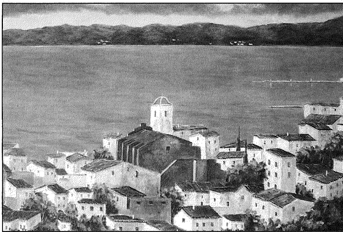
Oli d'Amelia Filizzola sobre Port de la Selva, que es podrà veure a l'Exposició celonina (AdBM)

La mostra recollirà un conjunt de 30 pintures dels artistes d'aquest portal artístic d'internet