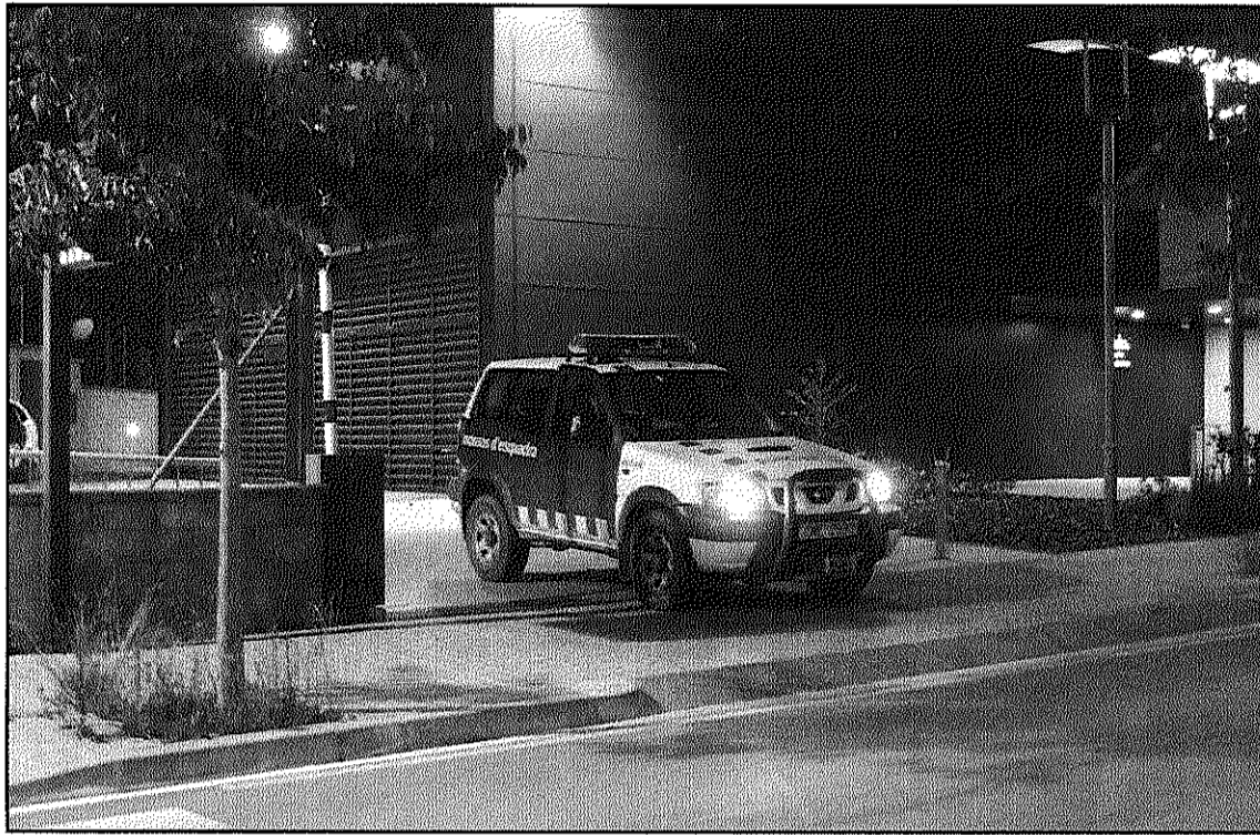
Un vehicle policial surt de les dependències dels Mossos a Sant Celoni (L'AdBM)

Un portaveu dels Mossos apunta que els autors haurien estat els mateixos