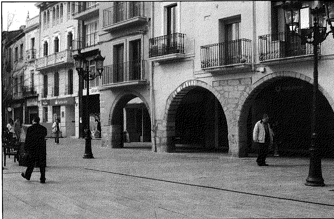
El projecte de l'aparcament va sorgir d'una iniciativa dels comerciants (L'AdBM)

Aquests requeriments que les empreses externes haurien posat sobre la taula suposarien una modificació dels principis de les bases del concurs inicial. I tot i que des de l'empresa Aparcaments de Sant Celoni SL nega que aquest