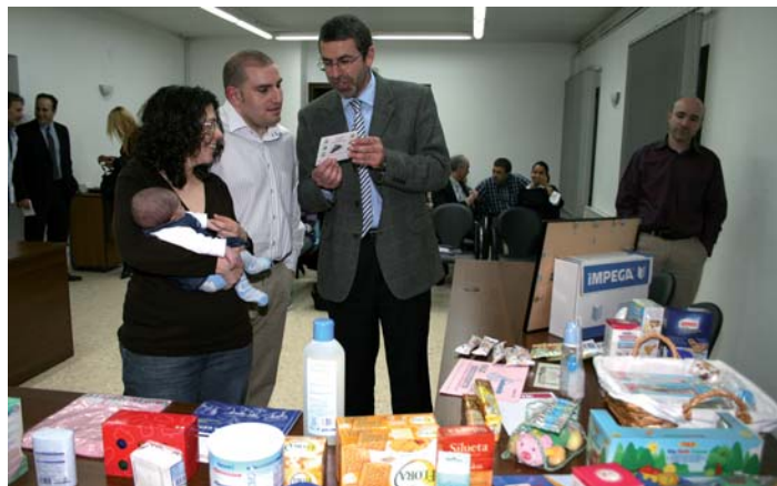
La Laia, a braços de la seva mare, el dia que va rebre la cistella "Vallbaby"

L'Ajuntament de Vallgorguina està molt satisfeta per la repercussió mediàtica que ha tingut la campanya i, sobretot, perquè no ha costat ni un sol euro a la caixa municipal.