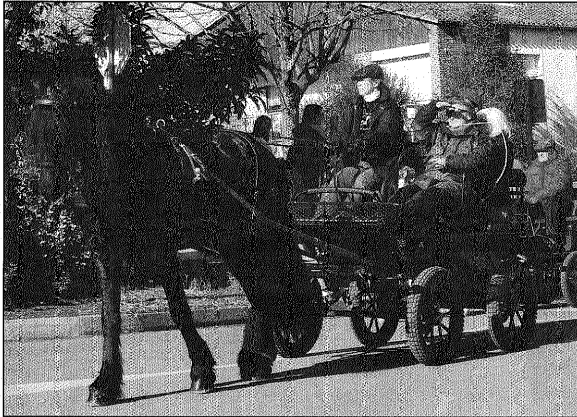
La Festa de Sant Antoni ja s'ha celebrat en diferents municipis del Baix Montseny (AdBM)

D'altra banda, cal recordar que el motiu d'endarrerir l'acte, que tradicionalment se celebra als voltants del 17 de gener, és per intentar aconseguir una major afluència dels animals dels pobles de les rodalies. I és que Vallgorguina