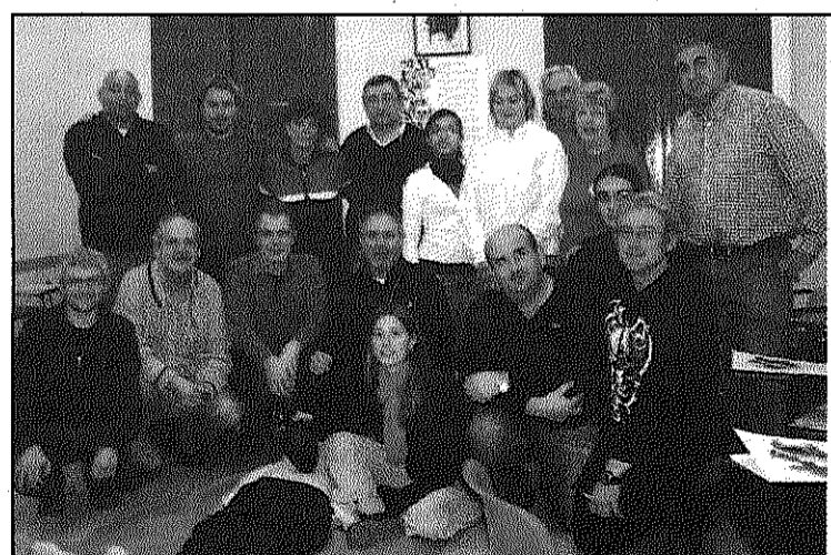
Els assistents al curs de Creu Roja (L'AdBM)

REDACCIÓ. Sant Celoni Creu Roja de Sant Celoni i el Baix Montseny ha portat a terme un nou Curset de Desfibriladors Semi Automàtics. Es tracta del segon curs que es porta a terme amb una participació d'uns 15 alumnes, voluntaris la majoria de Creu Roja, però també de persones externes d'empreses de la