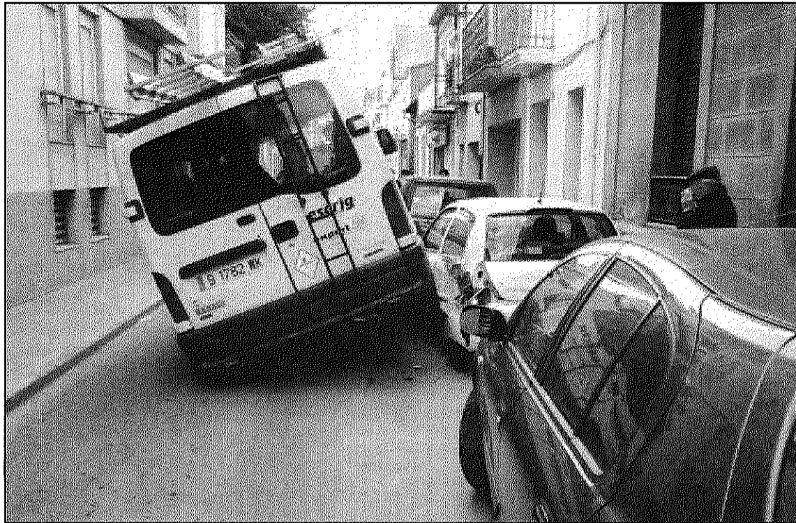
L'assaltant va xocar amb la furgoneta contra diversos vehicles

Afortunadament, els fets van passar uns minuts abans que diversos escolars s'adrecessin a l'Ateneu per assistir a una activitat musical. De fet, van ser els mateixos responsables i treballadors de l'Escrig que, en adonar-se del fet i intentar interceptar el lladre, el van aconseguir reduir fins que va arribar la Policia Local. Tot i