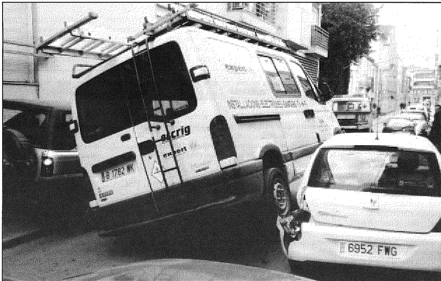
La furgoneta que havia agafat el lladre va pujar sobre un dels vehicles que hi havia estacionats a la vorera (L'AdBM)

Roba una furgoneta a la carretera Vella de Sant Celoni i s'accidenta durant la fugida amb quatre cotxes (Pàgina 8)