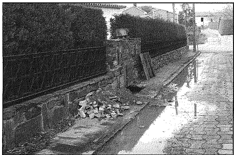
Un carrer entollat, aquest dimecres, per les fuites d'aigua (L'AdBM)

Veïns de Can Pagà de Palau denuncien talls i avaries a la xarxa d'aigua (Pàgina 11)