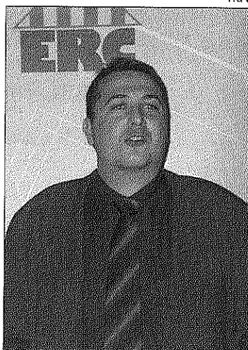
El excabeza de lista de ERC entre los que más gastaban.