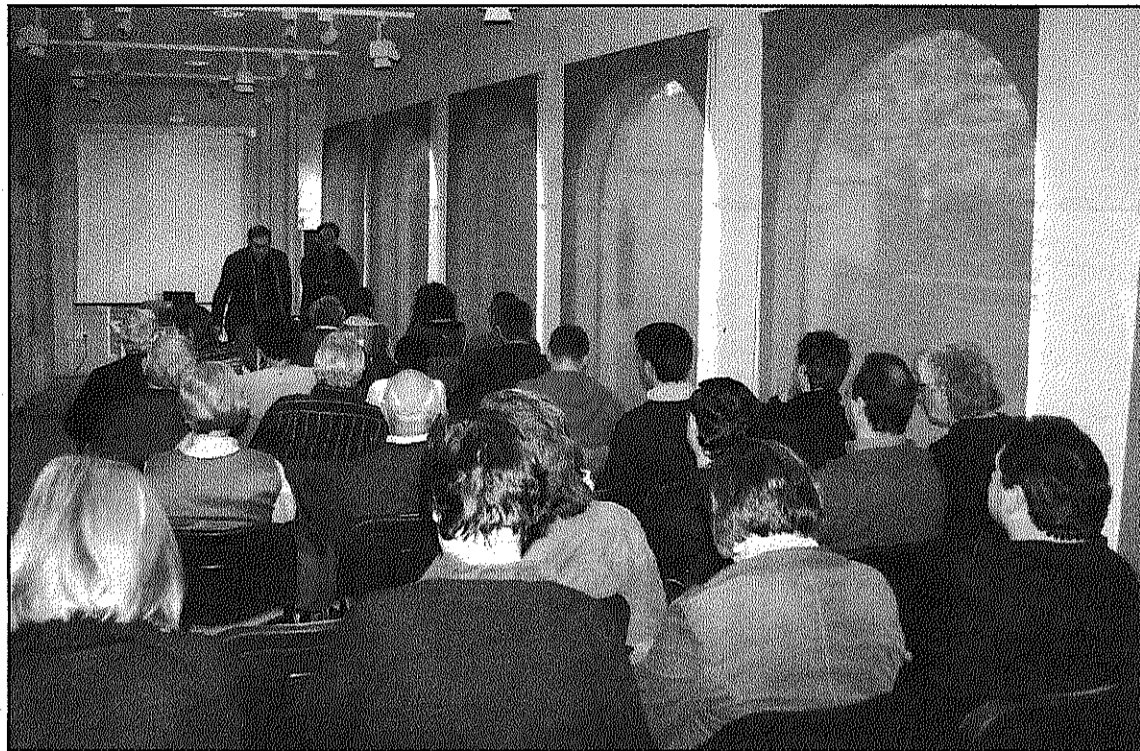
Un moment de la sessió inaugural del curs, amb la sala d'actes del Museu plena a vessar