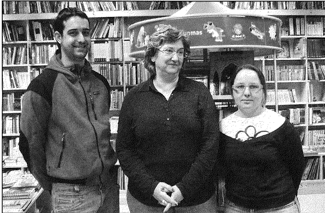
La llibreria 'Els 4 Gats' de Sant Celoni inicia els actes del 25è aniversari de la seva obertura (AdBM)

Ja a principis de març, i també al local de la llibreria, es farà la presentació del llibre