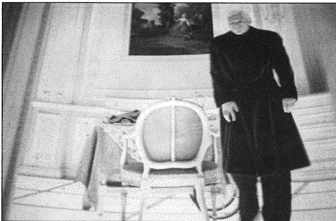
Fotograma de la pel·lícula "2001: Una odisea en el espació", que tancarà el cicle de cinema