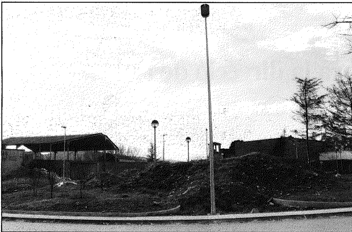
Una imatge de la situació de la rotonda, d'ahir dijous

Segons ha explicat l'Ajuntament, actualment s'està redactant un projecte de remodelació de la rotonda que