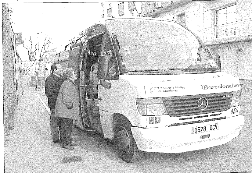
► Una parada d'autobús a Sant Celoni, localitat que centralitzaria el nou sistema de transport de la zona.

MENYS VEHICLES // La proposta serà presentada abans del 17 de febrer com a al·legació al Pla de Transport de Viatgers (PTV) de la Generalitat. Actualment, els municipis del Baix Montseny pateixen un greu déficit de transport públic. Si cada un d'aquests pobles sol·licités a la Gene-