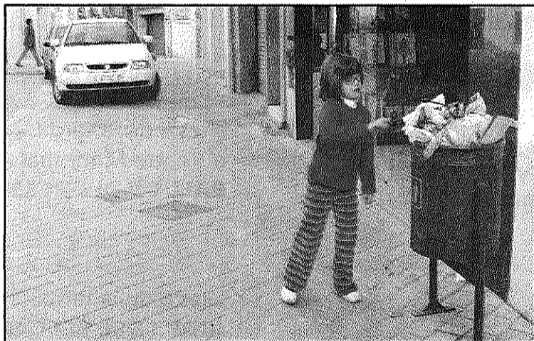
Imatge de la paperera a la plaça Comte del Montseny

Tal i com ja va informar aquest setmanari, el Consistori s'ha reunit amb responsables de la Generalitat per analitzar sobre el terreny l'espai. La Generalitat va veure amb bons ulls la zona de Ca l'Alzina Nou per construir el nou parc. Per aquest motiu, ara l'Ajuntament ha demanat també a Emergències que comuniquin per escrit el seu acord. Això mentre es manté la negociació amb el propietari per a l'adquisició dels terrenys.