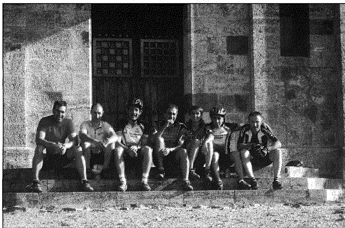
Una imatge de la sortida pels Corriols del Montseny del setembre del 2006

Sant Pere de Vilamajor. La ruta del Pi de les set branques a Viladrau serà la primera de les sortides de l'any 2008 que farà el grup Caminaires de Faldes, de Sant Pere de Vilamajor. La caminada es farà el proper dimecres, 9 de gener, i la sortida serà com és habitual a les 8 del matí del Restaurant Casa Alba, al nucli de les Faldes de Sant Pere de Vilamajor, des d'on es desplaçaran a Viladrau per fer l'activitat. REDACCIÓ.