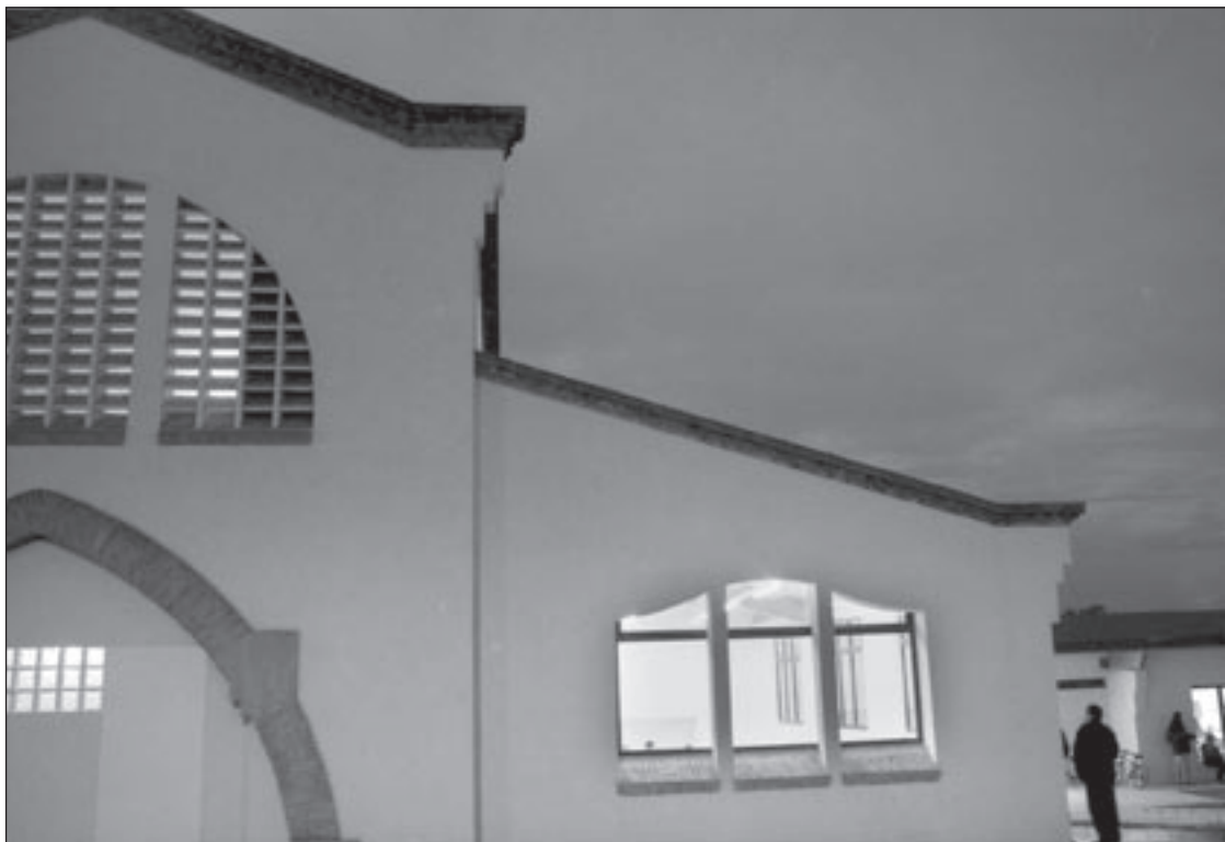
L'antic escorxador, que acull la biblioteca municipal, s'ampliarà dins d'aquesta legislatura